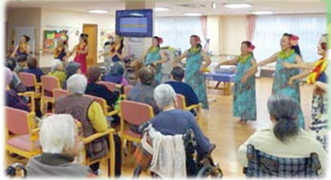
フラガールの方々をお迎えした、レクリエーション